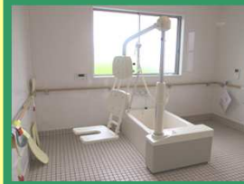
デイサービス浴室