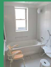
賃貸住宅内個別浴